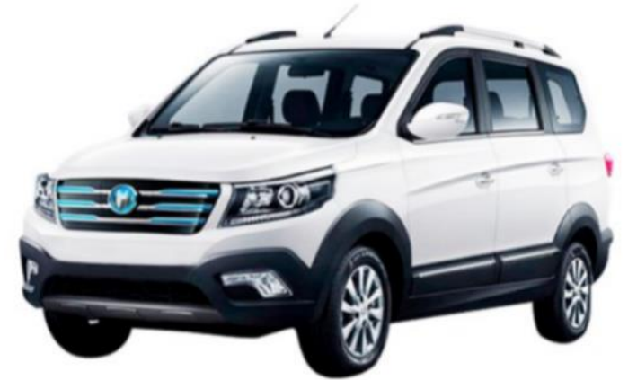
KEYTON ER7 EV SUV