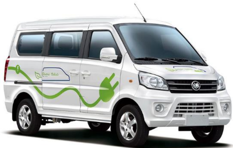
KEYTON K30 EV VAN