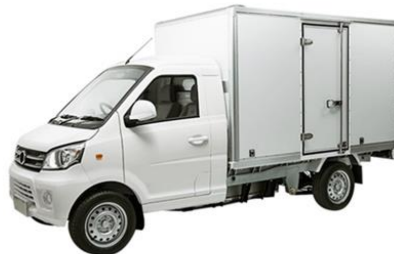
KEYTON K54 EV TRUCK