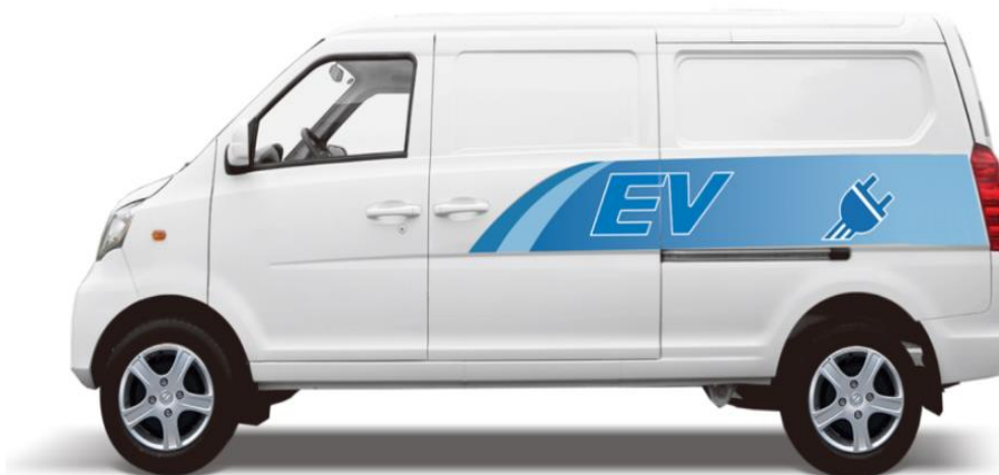
KEYTON K30 EV PANEL