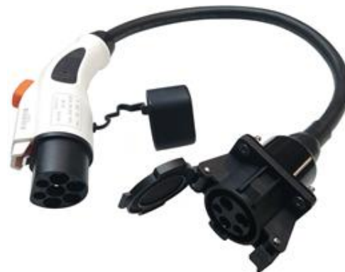
Adaptador AC Tipo 1 (J1772) a GB/T