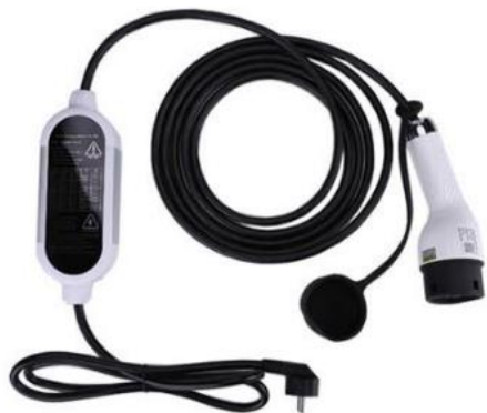
Cargador Portátil de Vehículo Eléctrico